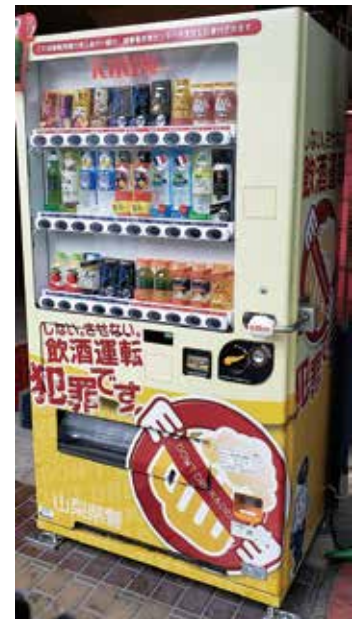
飲酒運転根絶ラッピング寄付金付自動販売機

新型コロナウイルスが猛威を振るい社会全体にマスクが不足する中で、被害者支援活動に賛同され、当センターあてに大量のマスクの寄贈がありました。不足していたマスクでしたが、支援活動におおいに活用させていただきました。