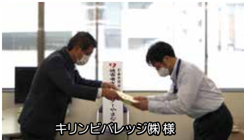
キリンビバレッジ㈱様