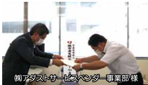
㈱アダストサービスベンダー事業部様