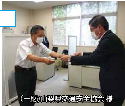
(一財)山梨県交通安全協会様

また、被害者支援に賛同され、被害者を出さない飲酒運転根絶啓発活動とともに寄付金付自動販売機の設置活動を継続的に行って頂いている皆様に感謝状を贈呈いたしました。