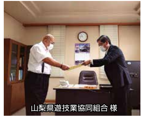
山梨県遊技業協同組合様